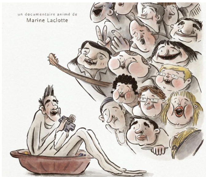
FOLIE DOUCE, FOLIE DURE de Marine Laclotte / Folimage